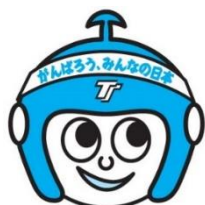
東海トラベルキャラクター たびすけ

主催/浜名湖囲碁まつり実行委員会(委員長 日本棋院浜北支部長 鈴木広和) 後援/(公財)日本棋院、浜松市、浜松商工会議所、(公財)浜松・浜名湖ツーリズムビューロー (公財)浜松文化振興財団、サーラグループ、中日新聞東海本社、静岡新聞社・静岡放送 助成/公益財団法人 静岡県西部しんきん地域振興財団 協賛/花の舞酒造(株)、爛柯(日本棋院静岡支部)、THE HAMANAKO、(株)東海トラベル