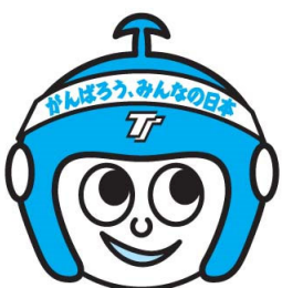
東海トラベルキャラクター たびすけ

主催/浜名湖囲碁まつり実行委員会(委員長 日本棋院浜北支部長 鈴木広和) 後援/(公財)日本棋院、浜松市、浜松商工会議所、(公財)浜松文化振興財団、(公財)浜松・浜名湖ツーリズムビューロー、 sala(サーラ)グループ、中日新聞東海本社、静岡新聞社・静岡放送 協賛/花の舞酒造(株)、爛柯(日本棋院静岡支部)、THE HAMANAKO、(株)東海トラベル